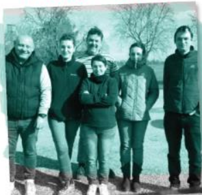
TERRA ALTER (GERS)

Plateforme de collecte et de transformation de fruits et légumes bios et locaux