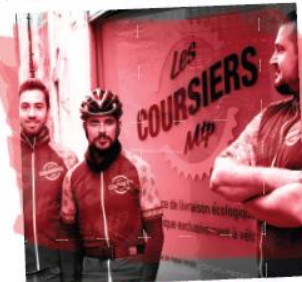
LES COURSIERS MONTPELLIÉRAINS (HÉRAULT)

Technologies immersives pour le secteur touristique