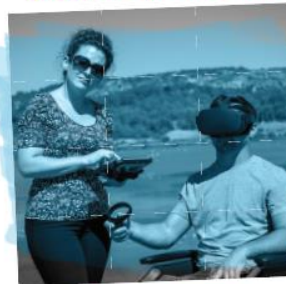
CONCEPT EVASION (AUDE)

Technologies immersives pour le secteur touristique